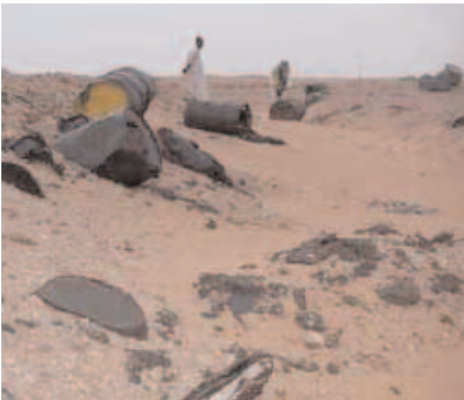
Une tranchée près de Reggane Plateau, 15 novembre 2007.

L'ensemble de la plateforme offre un spectacle de désolation. Malgré le sable ocre du désert qui recouvre et découvre inexorablement les vestiges : câbles électriques, ferrailles, tuyaux, conduites d'eau jonchent le sol sur quelques hectares. Je retrouve ici les mêmes enchevêtrements de câbles abandonnés découverts sur les plages de l'atoll de Hao, autre haut lieu du désastre post-nucléaire de Polynésie. Difficile d'attribuer une « paternité » à cette poubelle à ciel ouvert : vraisemblablement, les installations de la plateforme n'ont pas été démantelées dans les règles lors du départ des Français en 1966. Mais les destructions et récupérations anarchiques ont apparemment été aussi le fait d'unités militaires algériennes qui occupèrent les lieux par la suite comme en témoignent de nombreux graffitis.