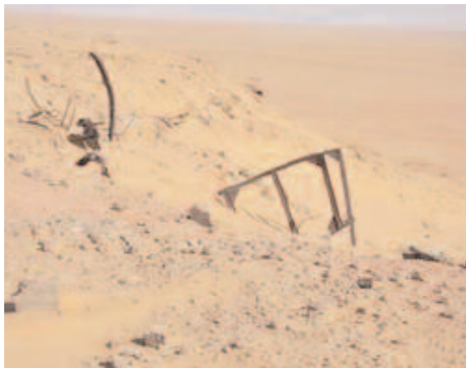
Ruine de Hammoudia avec vue sur le désert, 16 novembre 2007.

Les abords de la route en contrebas, qui conduit à l'entrée du CSEM, témoignent d'un manque flagrant de respect de l'environnement. Des centaines de fûts métalliques, probablement de bitume, ont été, depuis les années 1960, abandonnés là sur un vaste espace simplement entouré de barbelés. Ce spectacle désolant laisse présager de ce que nous allons découvrir en poursuivant notre visite.