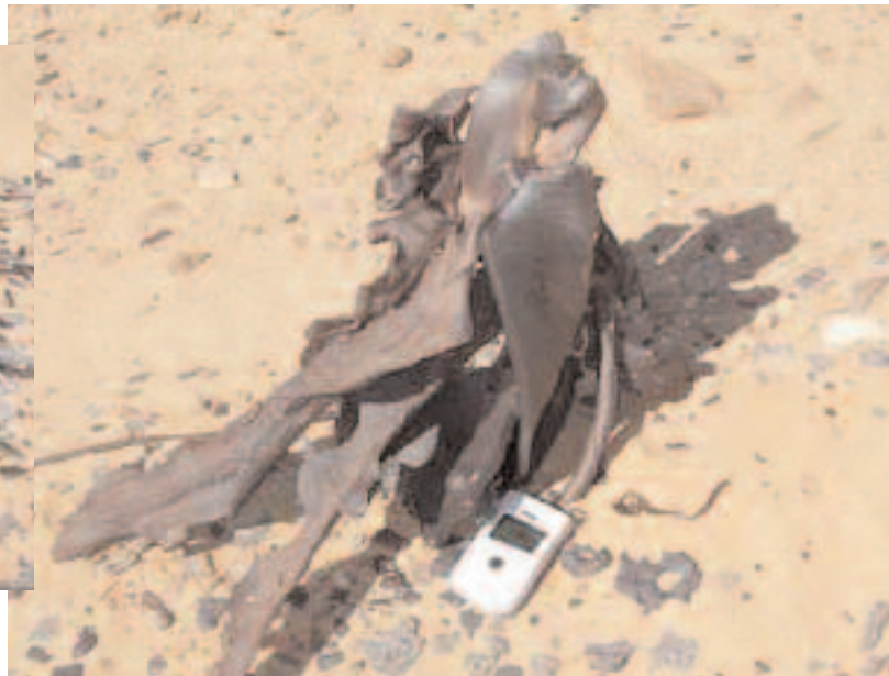
Sable vitrifié (photo de gauche) et ferrailles (photo de droite) à Gerboise bleue, 16 novembre 2007.

Les laboratoires et leurs infrastructures n'ont finalement été utilisés que pendant un peu plus cinq ans, de 1960 à 1966. Voilà une belle illustration des propos du général de Gaulle : « La défense n'a pas de prix » !