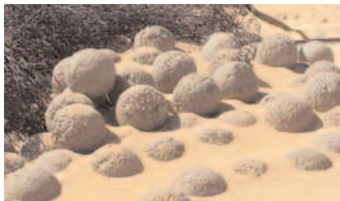
Boulets à Gerboise rouge 16 novembre 2007.

Pourquoi cette distorsion entre le discours sur le « démantèlement » des sites sahariens effectué dans les « meilleures conditions », régulièrement tenu par les autorités françaises, alors qu'à In-Ekker comme à Reggane Plateau ou Hammoudia, on constate le contraire ? Pourquoi les autorités françaises s'appuient-elles encore sur le rapport de l'Office parlementaire d'évaluation des choix scientifiques et technologiques 2 alors qu'aucun des deux rapporteurs n'a jamais mis les pieds sur les sites sahariens ?