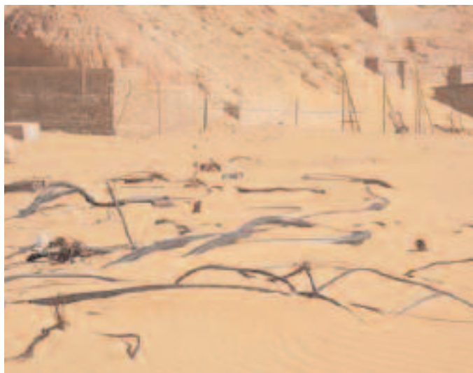
État de la zone CEA de Reggane 17 novembre 2007.

de ces remarques qui recouvrent certainement une réalité : les dattes, comme l'eau des fogaras, sont à la base de l'existence quotidienne des Sahariens et le moindre dérèglement dans ce domaine ne peut pas échapper à l'observation du « jardinier » des palmeraies. En écho, j'entends le même discours à propos de l'empoisonnement du poisson — seule source de protéines animales — à Mangareva.