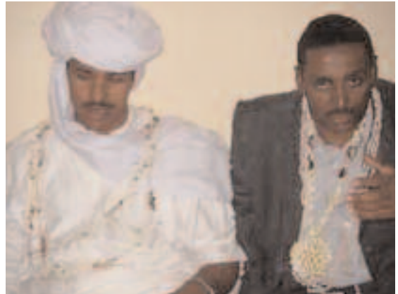
Le cheikh et le maire de Reggane lors de la remise des colliers polynésiens le 17 novembre 2007.