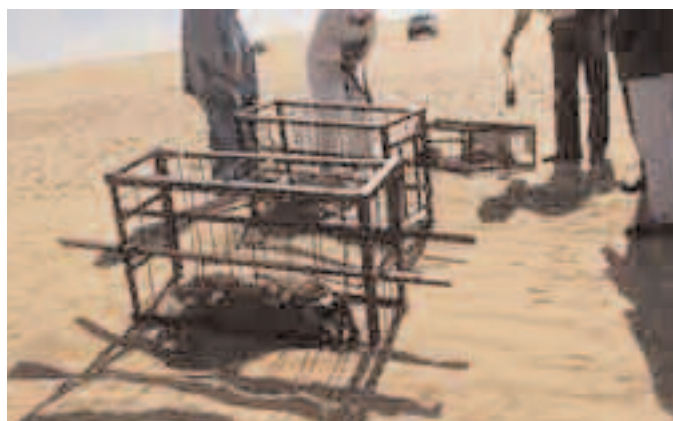
Cages (oubliées) contenant les cadavres d'animaux exposés lors du tir Gerboise blanche (1 er avril 1960).

À mon avis, le danger est bien là : ces fragments alvéolés noirs ont déjà pu et pourront probablement attirer la curiosité des visiteurs éventuels. Ces pierres noires du désert, chargées de minuscules fragments de plutonium, pourraient très bien se retrouver transformées ici en pendentifs ou là en souvenirs du désert saharien. Probablement impressionné par leur nombre à Gerboise bleue, je n'avais pas osé prendre en main un de ces fragments. Ici, à Gerboise blanche, la curiosité l'emportait : en soupesant un fragment, je me rends compte à la fois de sa fragilité et de son faible poids. Il est donc très vraisemblable que les vents aient dispersé le sable vitrifié à des distances difficilement évaluables. Ignorant des risques, un artisan, un fabricant de souvenirs peuvent très bien inhaler ou avaler des poussières noires radioactives lors de la taille ou du polissage.