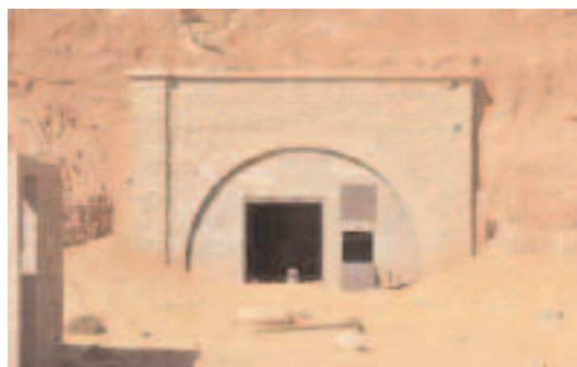
Entrée d'un tunnel sur la zone CEA de Reggane 17 novembre 2007.

la route, on constate la volonté officielle de « faire revivre le désert » : des pousses de palmiers ont été plantées à intervalles réguliers et sont alimentées en eau par un système de goutte à goutte économe en eau. Les palmeraies doivent leur existence à un ingénieux système d'irrigation, fruit de pratiques ancestrales et soigneusement entretenu. Ces canalisations souterraines — les « fogaras » — donnent vie à cet univers minéral. Les habitants du désert ont appris, de génération en génération, à préserver l'eau comme une grande richesse. À l'heure où le monde développé commence à prendre conscience de la nécessité de sauvegarder cette ressource indispensable à la vie, l'ingéniosité des « jardiniers » des palmeraies devrait servir d'exemple.